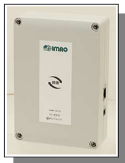
ステーション親機 (親機)

はじめに、同梱物がすべてそろっているかご確認ください。 万一、不足や損傷などがございましたら、お手数ですが、弊社「ファクトリーステーション お問い合わせ窓口」（本紙最終面に記載）までご連絡ください。