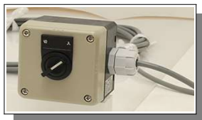
セレクタスイッチ