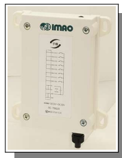
ステーション子機 (子機)