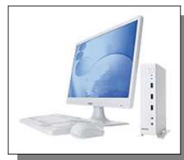
ステーション サーバー