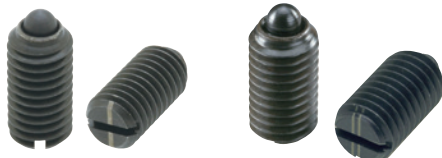
ZSP (軽荷重用 識別:1本ライン)