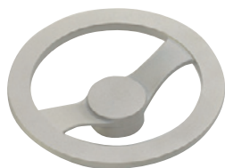
NSTH (握り用メネジなし)