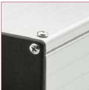
4隅の穴は、市販のタッピンネジ(φ4.2×9.5)用のザグリ穴です。