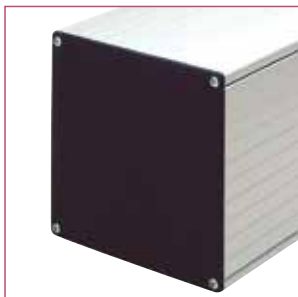
コンジットを組んだ時の端面のキャップです。