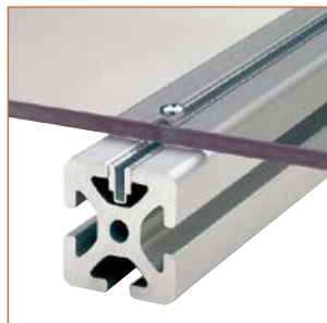
任意の位置でパネルエレメントが取付けられます。