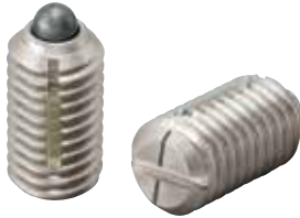
LSPLL-SUS (軽荷重用 識別:1本ライン)