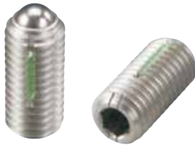
LBSUH-A (重荷重用) 識別:2本ライン