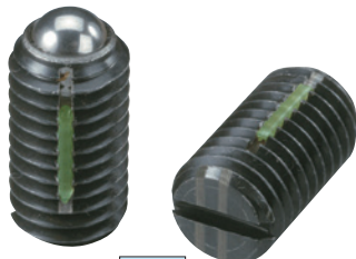
LBSTH (重荷重用 識別:2本ライン)