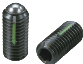
LBSTH-A (重荷重用 識別:2本ライン)