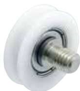
GRL-M-P-R-SUS (ボルト付きタイプ)