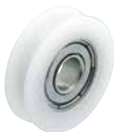
GRL-P-R-SUS (ボルト無しタイプ)