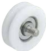
GRL-M-P-D-SUS (ボルト付きタイプ)