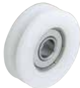
GRL-P-D-SUS (ボルト無しタイプ)