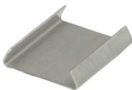
サイドプレート(AK2、BK2用)