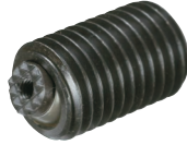
TBU-S 20030~24080 (锯齿型)