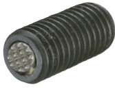
TBU-S 12025~16050 (锯齿型)