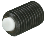
TBU-E 20030~24080 (树脂型)