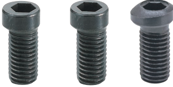
MBCS 04, 16