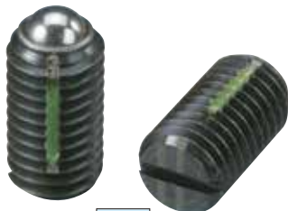
LBSTH (重载荷用 识别: 2根线)