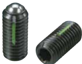
LBSTH-A (重载荷用 识别: 2根线)