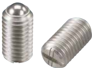
BSUH (重载荷用 识别:2根线)