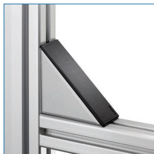
埃や汚れから保護します。