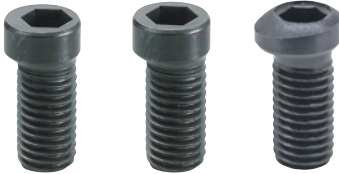
MBCS04 ,16 MBCS06 ~10 MBCS12