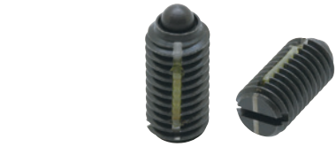
LSPLL (軽荷重用 識別:1本ライン)