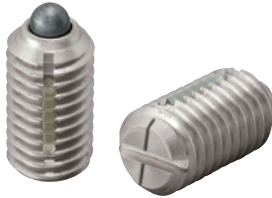
LSPLL-SUS (軽荷重用 識別:1本ライン)