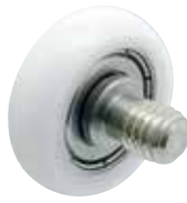
GRL-M-P-U-SUS (ボルト付きタイプ)