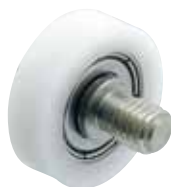
GRL-M-P-F-SUS (ボルト付きタイプ)