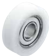
GRL-P-F-SUS (ボルト無しタイプ)