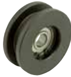
GRL-SH-H (スチール製、焼入れ品)