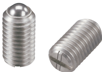
BSUH (重荷重用 識別:2本ライン)