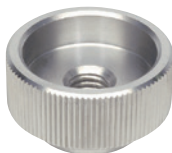
BJ750-**201N (ステンレススチール)